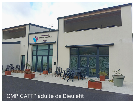
CMP-CATTP adulte de Dieulefit

Le Pôle Sud regroupe les unités d'hospitalisation temps plein (UPS1 et UPS2) et des structures extrahospitalières sur les secteurs géographiques de Crest, Nyons, Die et Dieulefit.