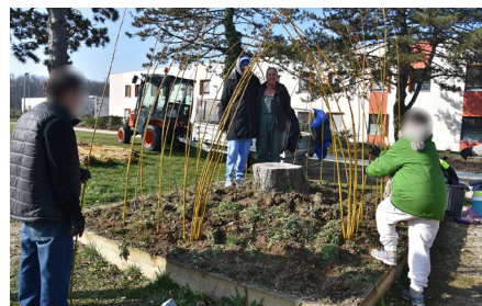
Création d'une cabane en osier par les usagers, devant la cafétéria, en février 2025.