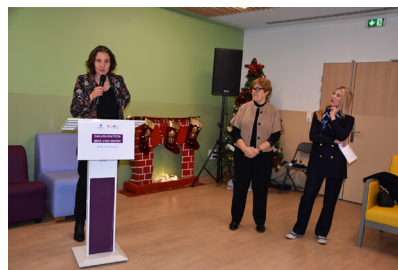
Inauguration de la nouvelle MAS, le 16 décembre 2025.