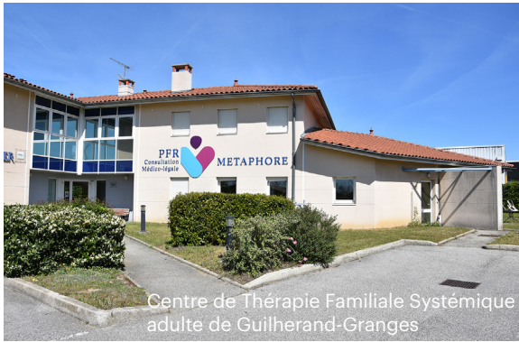
Centre de Thérapie Familiale Systémique adulte de Guilhaierand-Granges