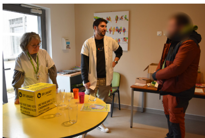
Stand de sensibilisation à l'UPS2 pour le Dry January, le 8 janvier 2026.