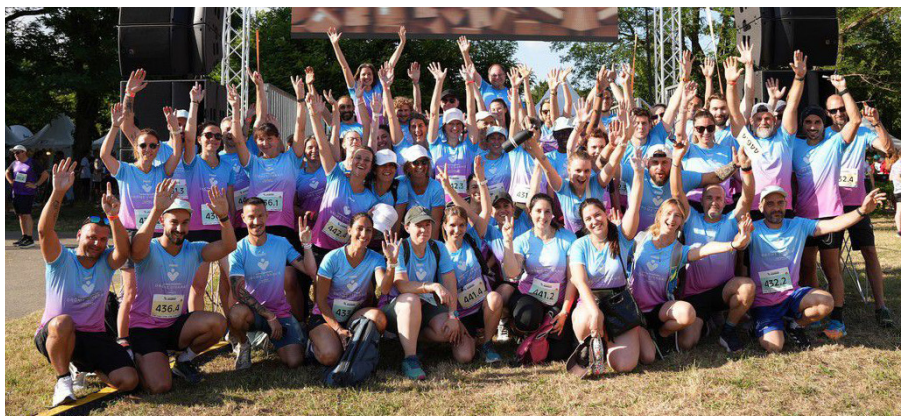
Participation record du CHDV à l'Afterwork running de Valence, le 26 juin 2025 !