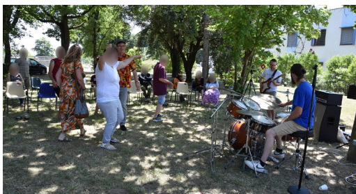
Ambiance rock à la fête de la musique au CHDV, le 18 juin 2025.