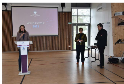
Cérémonie des voeux au personnel et remise des médailles du travail, en présence de la direction et de la présidence du CH Drôme Vivarais.