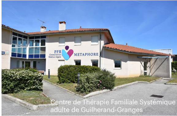
Centre de Thérapie Familiale Systémique adulte de Guilhaierand-Granges