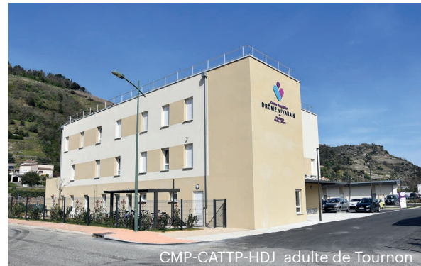
CMP-CATTP-HDJ adulte de Tournon

Le pôle Nord regroupe les unités d'hospitalisation temps plein (UPN1 et UPN2) et couvre des structures extrahospitalières sur les secteurs géographiques de Romans, de Saint-Vallier et de Tournon-sur-Rhône.