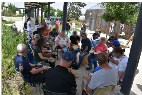
Fête de la musique avec les usagers.