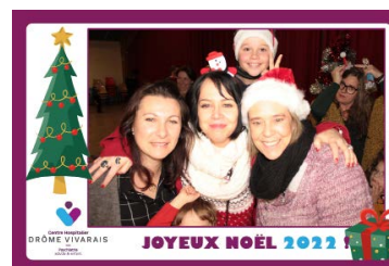
Moment convivial en famille à l'Arbre de Noël.