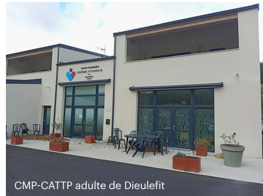
CMP-CATTP adulte de Dieulefit

Le pôle Sud regroupe les unités d'hospitalisation temps plein (UPS1 et UPS2) et des structures extrahospitalières sur les secteurs géographiques de Crest, Nyons, Die et Dieulefit.