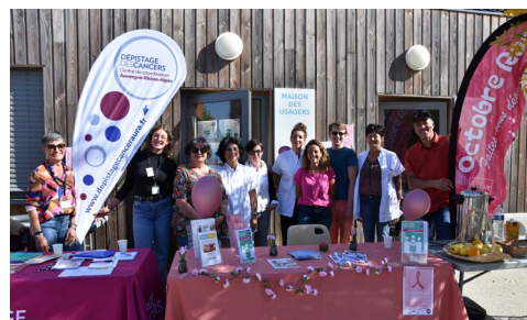
Belle mobilisation des équipes du CH Drôme Vivarais et ses partenaires pour l'action Octobre rose.