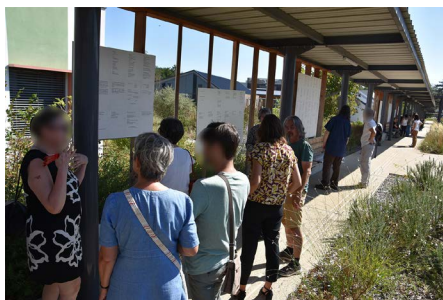
Vernissage de l'exposition « Poésie » dans la cadre du dispositif Culture et Santé.