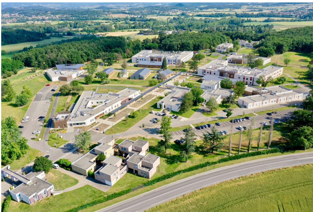
Vue aérienne du Centre Hospitalier Drôme Vivarais à Montéléger, route des Rebatières.

L'hôpital compte 825,48 ETP rémunéré de personnel soignant et de support et 57,79 ETP rémunérés de personnel médical.