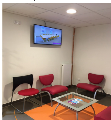
PC médical UP 1-4