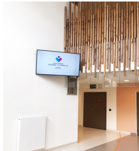
Bloc polaire UP 1-4

Les contenus diffusés peuvent aussi bien être des vidéos, des images ou encore des messages animés. Disposés aux endroits de passage, ils conviendront également aux visiteurs extérieurs.